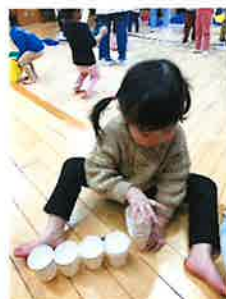
並べたり重ねたり、数えたり (R5.2 歳児)