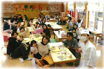
るんぴ de ランチ 「さかなの解体ショー」

地域の子育ての拠点として、安心して利用できる環境をつくり様々な遊びの経験を通して、子育ての知識や経験・技術を伝え、心身共に健康な子どもの育成及び子育て家庭支援を図り、保護者支援をしながら仲間づくりができる場の提供として子育て支援センターを開設しています。在園中のお子さんも親子・祖父母の方と一緒に遊びに来ていただけます。育児相談も行っています。どんな事でも話しに来て下さい。