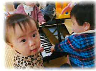
幼児音楽フェスティバル