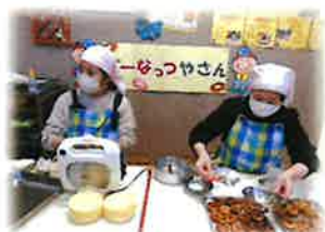
給食の先生による ドーナツやさんが 開店しました