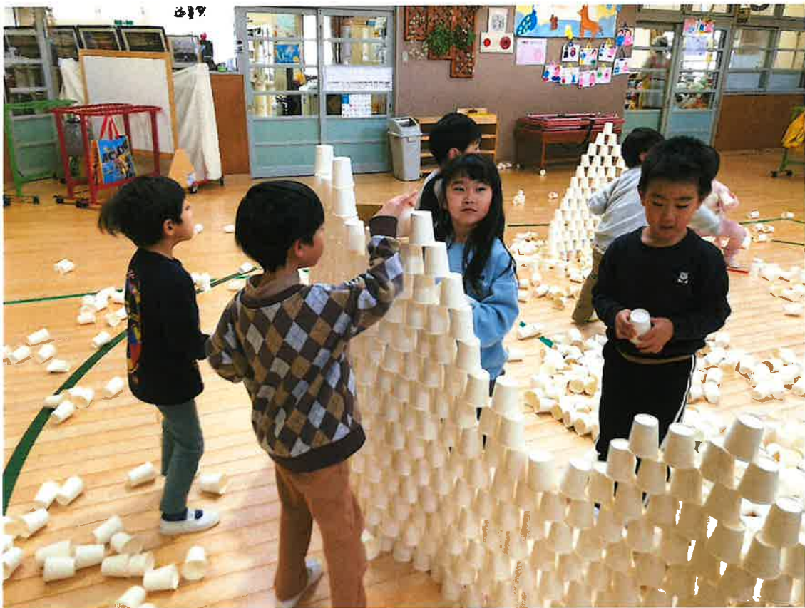
協力して遊戯室に大きなお城を作っています (R5.4 歳児)