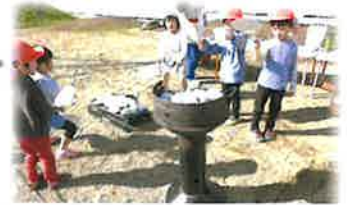
収穫したさつまいもを使った焼きいもづくり