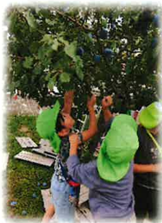
なかよし広場でのプルーン収穫

子どもたちが自然と触れ合い、その変化に気づく発見や感動は「いのち」との対話です。桜やプルーン、どんぐり等の四季折々の植物や、ありやダンゴムシ・せみなどの生き物に触れ合える自然体験を楽しみます。