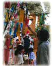
祖父母を迎えた たなばたま祭り

核家族が増え、子どもたちはお年寄りの優しいぬくもり、たくさんの知恵に触れることなく幼年時代を過ごしている子が多くなりました。一方、話し相手がない・外に出る機会の少ないお年寄りも多くなりました。このような今の社会、共に過ごし、一緒に触れあうことを通して、お互いを身近に感じて、大切にしたいものです。普段の保育の中で一緒に苗植え・芋ほりを楽しんだり、交流行事では伝承遊びをしたりと、ほのぼの温かなひと時をかけがえのない時間として大事にしております。